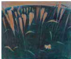
遠藤ミマン《蝶と芒》1941年 当館蔵

「モチーフを語る」は、画家の遠藤ミマン(1913-2004)が昭和36(1961)年に自身の作品について記述したエッセイです。本展では、このエッセイをテーマに、当館収蔵の遠藤ミマンの油彩画と、彼の言葉を紹介します。