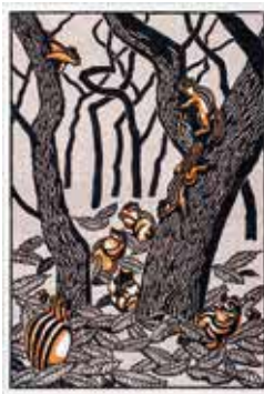
浅野武彦《樹上のなかま》 1986年 当館蔵