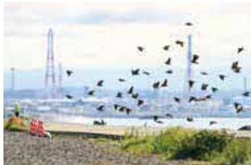
海岸に飛来するアオバトの群れ 苫小牧市糸井