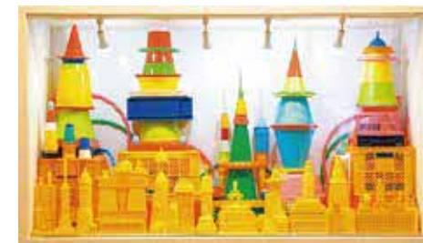
西田卓司《カラフルな降るカラー》2013年 作家蔵(参考作品)

既製品やサインなど、既存のイメージの引用により、ポップな色調の立体作品を制作する西田卓司(1983～)のインスタレーションを紹介します。