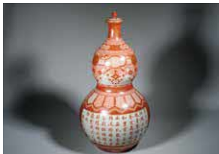
《墨出青松煙囪瓢型大瓶》