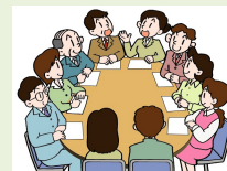
子ども・子育て審議会