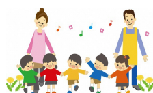
幼稚園、保育園、認定こども園