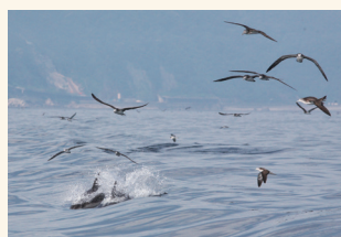
「カマイルカとミズナギドリの間」