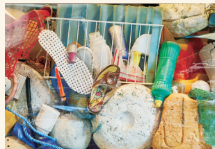
THE SNOWFLAKES (無題) 2022年 作家蔵