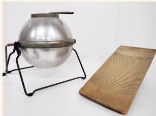
「手回し洗濯機と洗濯板」 昭和時代 当館蔵