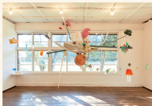
THE SNOWFLAKES (jam) 2022年 作家蔵