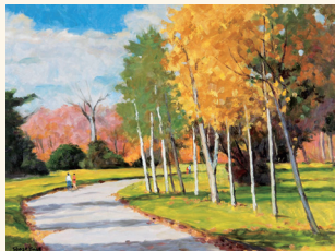
鹿毛正三《紅葉の北大演習林》 1996年 当館蔵