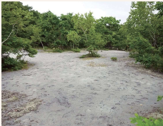
写真の解説 ■ 砂丘の様子

この地域は、ウトナイ湖の勇払川流出口の東部に分布する砂丘で、このあたりまでが海だったと言われている約 6,000 年前（縄文時代）から、現在に至るまでの自然の歴史を知るうえで重要な地域です。