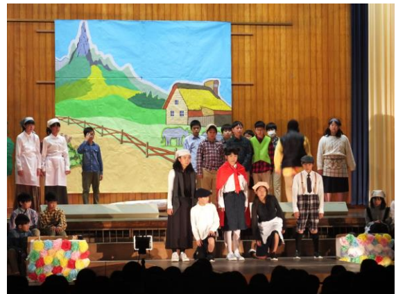
1年生による歌・器楽「まほうのおもちゃ箱☆」 6年生による劇「魔法をすてたマジョリン」