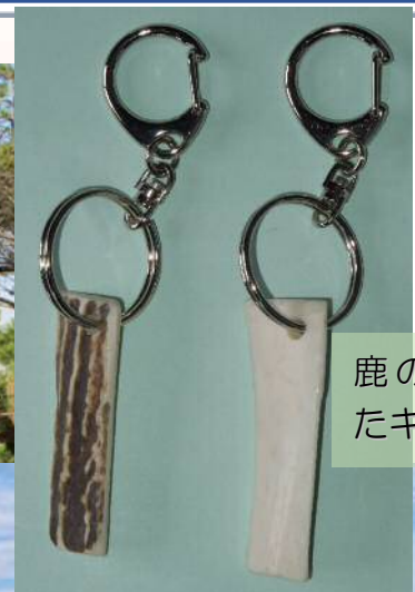
鹿の角を使ったキーホルダー