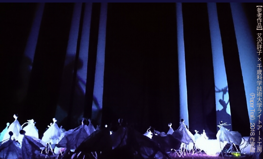
【参考作品】 艾沢詳子 × 千歳科学技術大学ライトアート工房 (Paper Trail) 2018 作家蔵