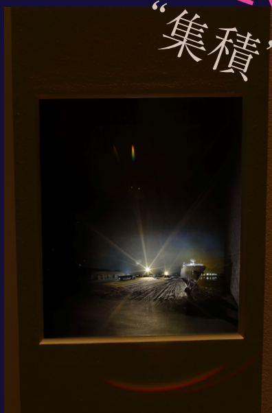
坂東史樹 《その仔犬をポケットに入れよ。旅を続けよう。》 2015 / 苫小牧市美術博物館蔵

大島慶太郎、大森記詩、佐竹真紀、中坪淳彦、坂東史樹、藤沢レオ、艾沢詳子 × 千歳科学技術大学ライトアート工房