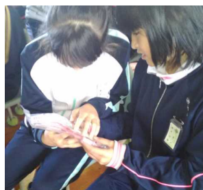
血液サンプルを手に