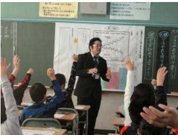
5年1組「グラフや表を用いて書こう」より

12月は2学期のまとめに取り組んでいます。学習や生活面、澄川小心得10箇条など自分なりに振り返り、2学期の成長を確かめていきます。