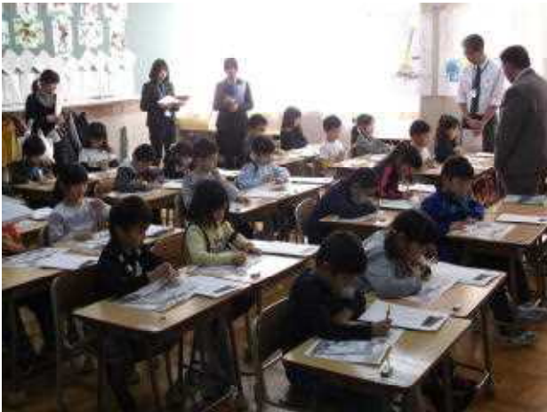
1年2組「じどう車くらべ」より

11月24日に公開研究会が開催されました。苦小牧市内の先生方に授業を見ていただきました。澄川小では国語科の学習を中心に、「主体的に学び、自ら意欲的に表現しようとする子」を育てるための授業づくりに取り組んでいます。」