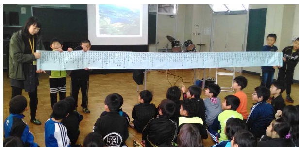
「こころの授業」3年生より

「こころの授業」に取り組んでいます。道徳教育とは少し異なります。自分と他人とのかかわりや、コ