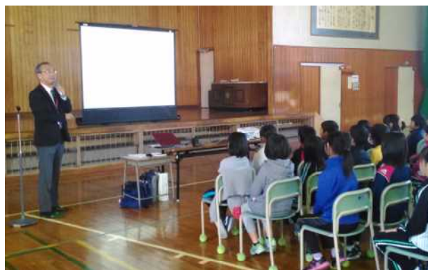
「こころの授業」5年生より