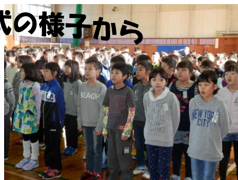
(右) 1年生冬休みの思い出の発表