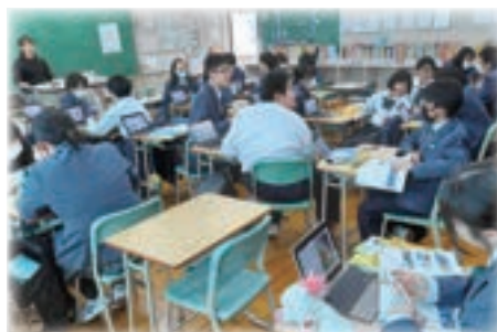
参観日 英語 (写真は1年生)