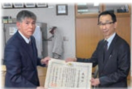
人権作文参加に対する感謝状贈呈