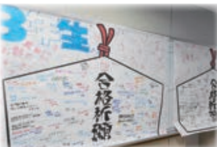
1・2年生より3年生へ合格祈願メッセージ