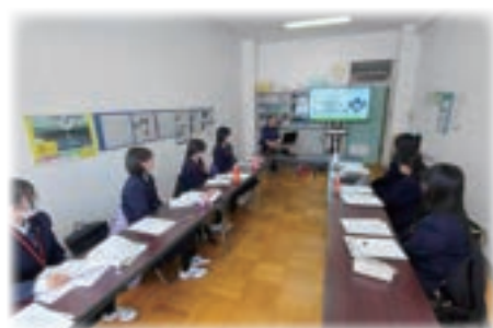
インターンシップ(南高生)への講話

※予定は変更になることがあります。ご了承ください。 心→心の教室相談員 SC→スクールカウンセラー ☒→図書館司書