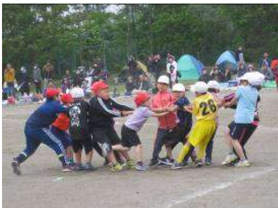
棒引き R1 [3・4年]