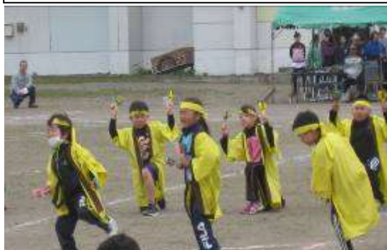
勇払デッドヒートレース[5・6年]