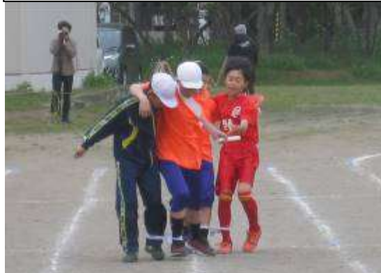
勇払中学校の学生ボランティア