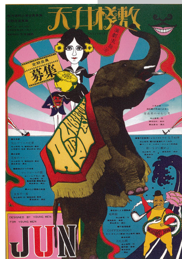
演劇実験室・天井棧敷【天井棧敷定期会員募集】1967年 デザイン・横尾忠則