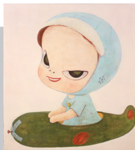
奈良美智（Pancake Kamikaze）1996年 ©Yoshitomo Nara