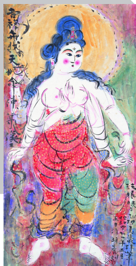
棟方志功《御吉祥大辨財天御妃尊像図》1966年

青木淳、阿部合成、伊藤隆介（特別出品）、及川正通、小野忠弘、菊地敦己、工藤甲人、工藤哲巳、今純三、斉藤義重、鈴木理策、高山良策、寺山修司、土井典、豊島弘尚、花輪和一、馬場のぼる、村上善男、奈良美智、棟方志功、横尾忠則