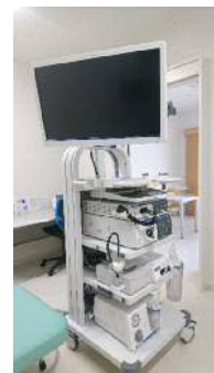
【胃内視鏡装置等一式】