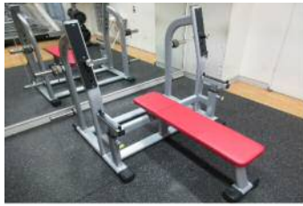
【スーパーインプレスベンチ】