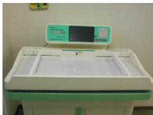
【乳幼児デジタル身長体重計】