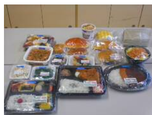
【基本セット・フードメニュー】