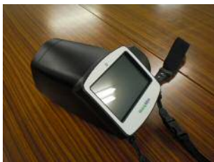
【スポットビジョンスクリーナー】