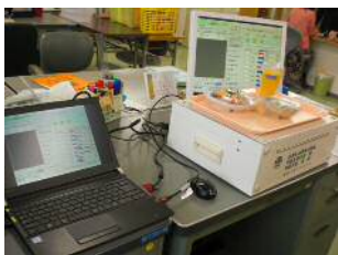
【ノートパソコン・センサーボックス・専用液晶モニター】