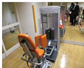
【アブダクション&アブダクション】