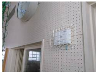
【屋内運動場機器設置】