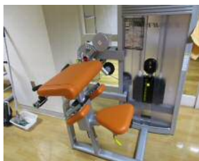
【アームカール&エクステンション】