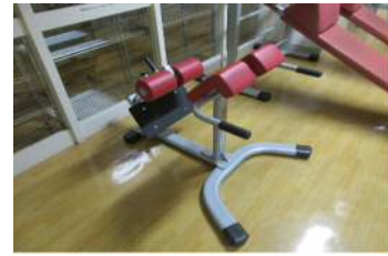
【45° バックエクステンションベンチ】