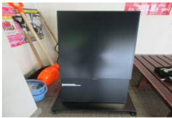
【デジタルサイネージ】