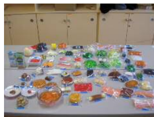
【基本セット・フードメニュー】