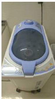
【内視鏡消毒装置一式】