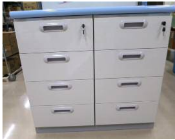
【引き出しユニット】