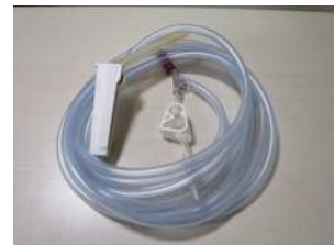
【チュービングセット】