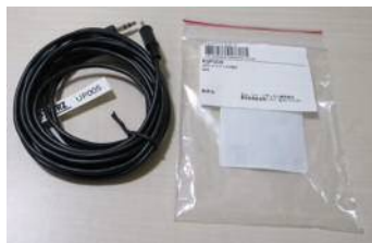
【コネスティングケーブル】