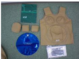
【妊娠シミュレーター】