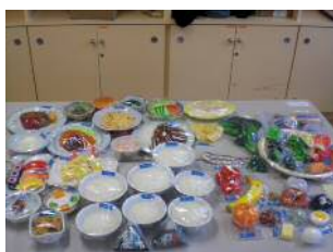
【基本セット・フードメニュー】