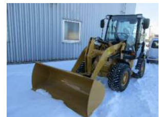
【ミニホイローダー】