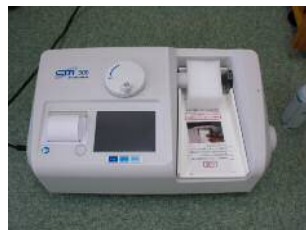
【超音波骨密度測定装置】