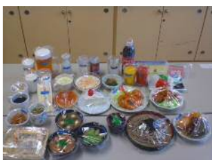
【基本セット・フードメニュー】