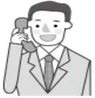
ほくしょう運輸(株)