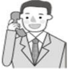
ほくしょう運輸(株)