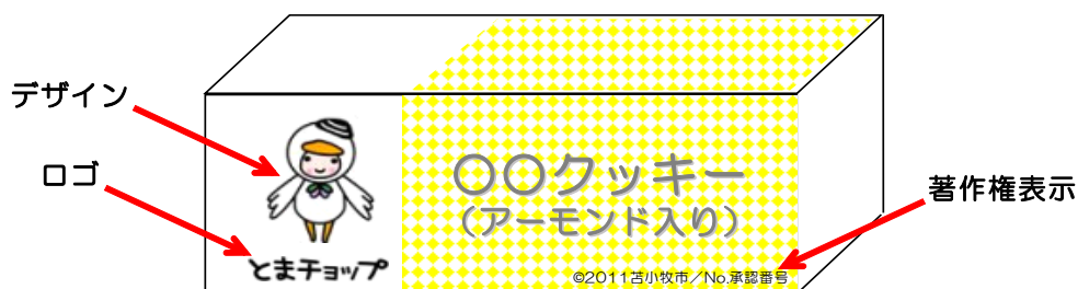
図 外装への表示例