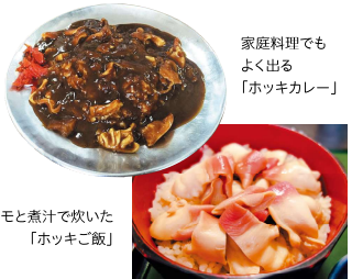
ヒモと煮汁で炊いた「ホッキご飯」

甘みを含んだシコシコとした歯ごたえがあり、肉厚でジューシーなのが特徴です。噛むほどに旨みが口の中に広がっていきます。また10月は、漁港で開催されるホッキまつりも好評です。(ホッキまつり→P29)