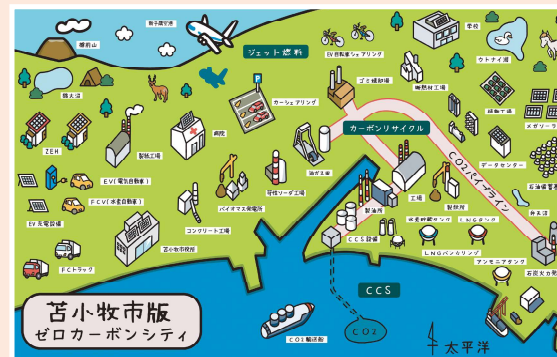
▲2050年までに目指す姿

国際拠点港湾の「苫小牧港」と北海道の空玄関口「新千歳空港」のダブルポートを擁し、さまざまな産業が集積。産業間でCO 2 を回収・有効活用し、ゼロカーボンシティを目指します。