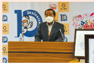
「2050ゼロカーボンシティ」への挑戦 会見模様

Carbon dioxide Capture and Storage (二酸化炭素を集めて閉じ込める)