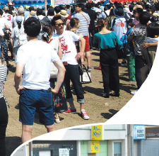
多くの市民が参加する市民祭り