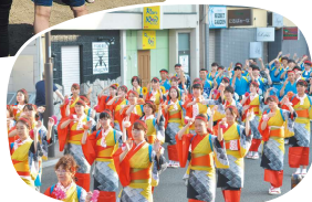
多くの市民が参加する市民祭り