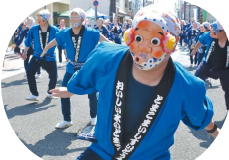
ユーモアたっぷり「ひよっこ踊り」