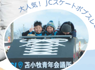
人気！JCSケートボード 苦小牧青年会館前

ドラム缶でジンギスカンを焼いて食べる名物の「しばれ焼き」をはじめ、キャラクターショーやゲーム機など豪華景品が当たるウルトラウインタークイズ、ちびっこすべり台など、寒さを吹き飛ばす催しが盛りだくさん！