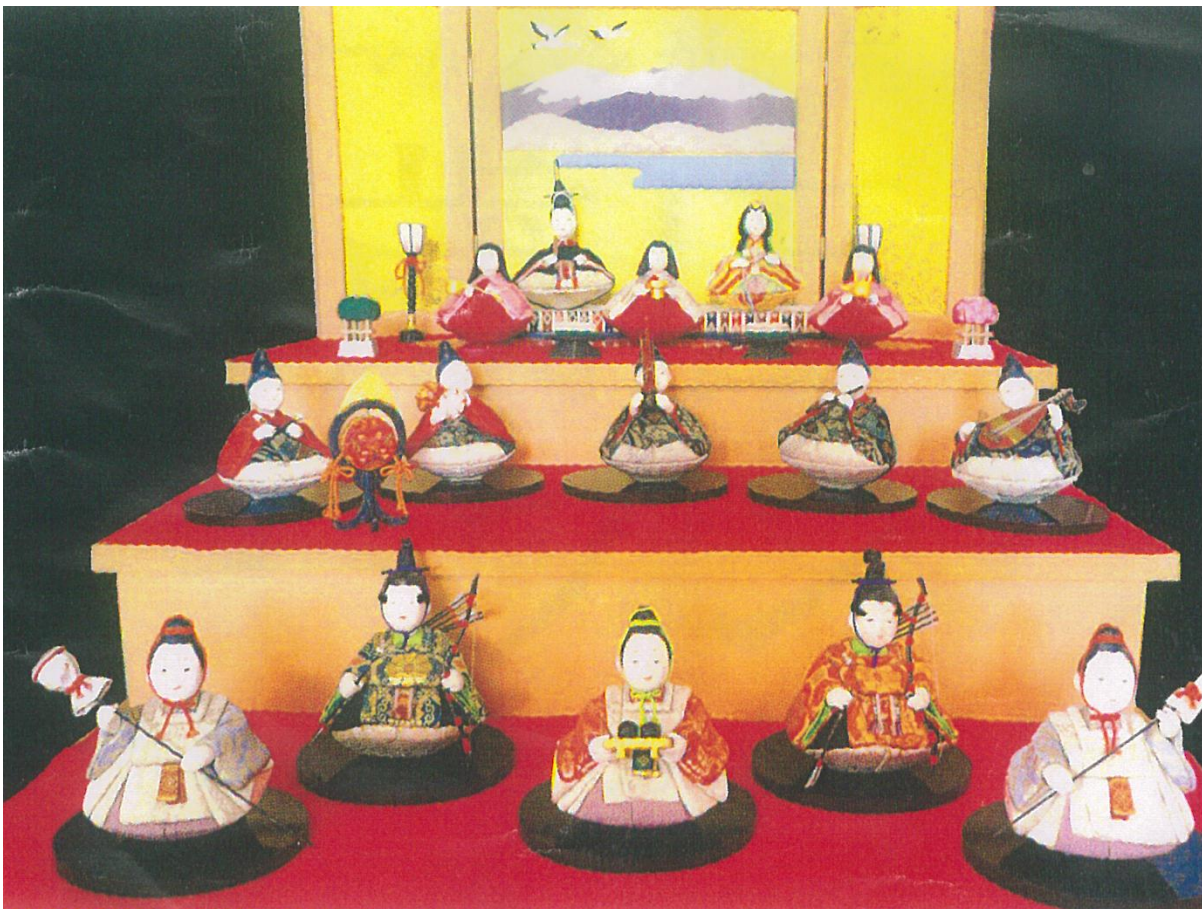
木目込み人形：苫小牧の特産・ホッキ貝を利用してお雛様