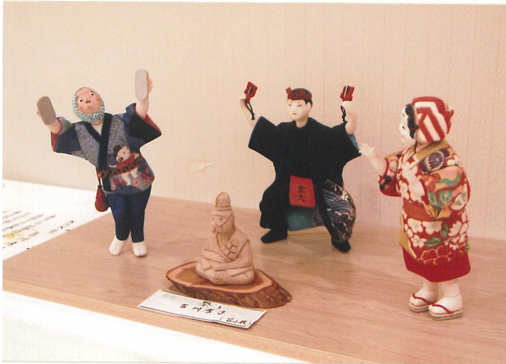
木目込み人形（左から） ひょっとこ踊り、干支のサル、よさこいソーラン、ひょっとこ踊りの合いの手