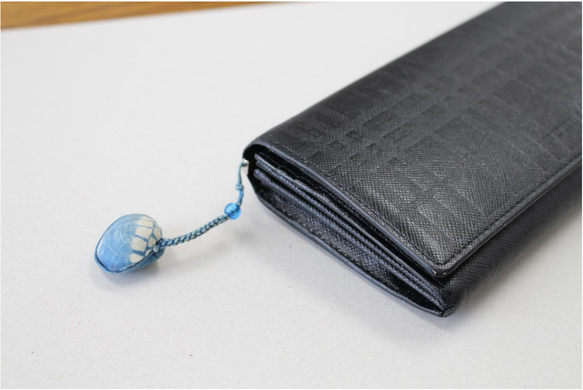
シジミ貝を利用したストラップ