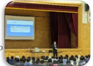
【体育館での説明の様子】

拓進小学校さんと拓勇小学校さんのご協力を得て、通常の学級と特別支援学級の体験入学を行いました。通常の学級の体験入学では、中学校教員が行う授業に主体的に参加する児童さんが多くいました。また、「ありがとうございました」と声を出して、下校する児童さんが多くいたことも非常に印象的でした。