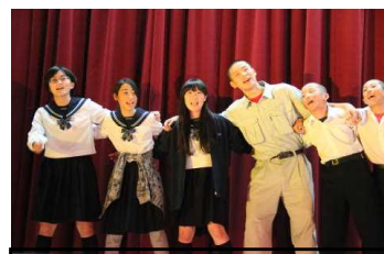
【2年演劇】「ぼくらとラッシュャー」