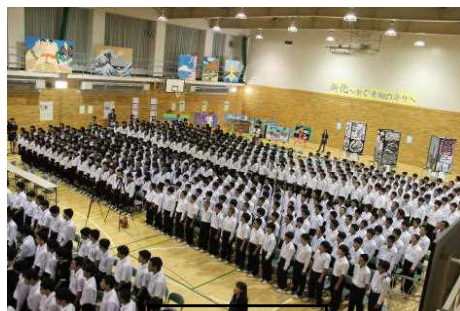
【開 祭 式】

学校の文化を創っていくためには、この「創造と伝統」を一つ一つ積み重ねていかなくてはなりません。