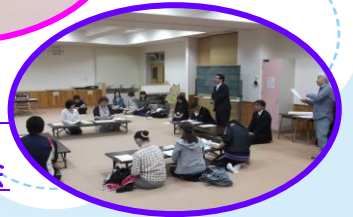
6 / 3 運営委員会