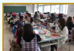
家庭科室の試食会