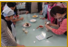
③食育系～スイーツ作り