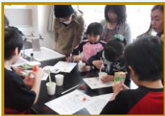
①学力向上系～入浴剤作り

校外委員会は朝、放課後の見守りや集団下校の協力、廃品回収グリーンボックス管理、育成連事業の協力等を担当しています。