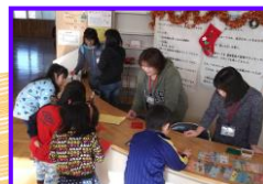
しおりプレゼント