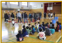
②体力向上系～ミニ運動会