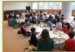
ふれあいルームの試食会