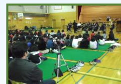
ふれあいコンサート