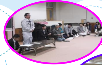
5 / 1.9 委員総会

今年度も多くの皆様に PTA 活動へご協力いただき、誠にありがとうございました！今年度の活動をふりかえり、次年度はより一層のご協力をお願いいたします。