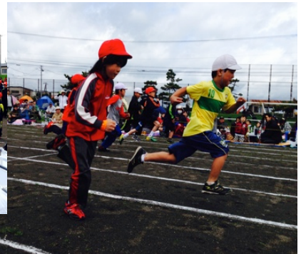
ゴールまで全力疾走の徒競走 ←1・2年 紅白玉入れ