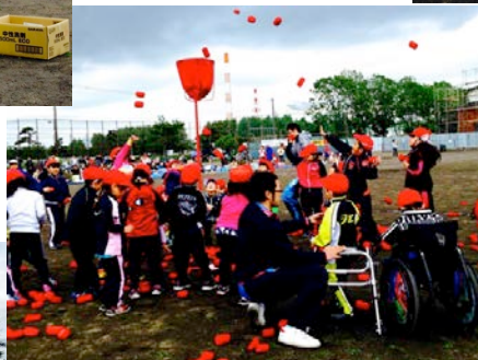
すみたんオリンピック →