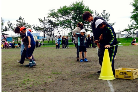
毎年恒例の 6年生の親子競技の様子