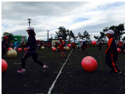
3・4年生による 西小ワールドカップ2014