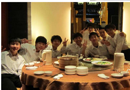
横浜中華街での夕食