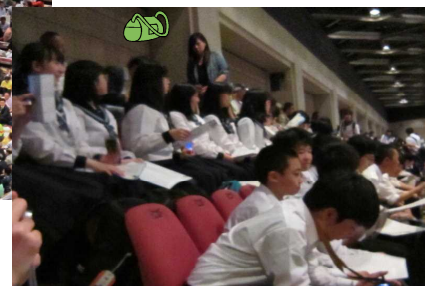
大相撲観戦のようす