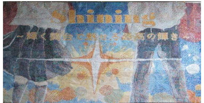
今年度の全校制作デザイン 3年1組 青葉えいみさん 原作

◆学校祭が終わると、生徒会活動の中心もいよいよ3年生から1・2年生へバトンタッチする時期となります。1・2年生には、これまでの学校生活を振り返り、よき伝統は引き継ぎながらも、改善に向けた課題を見つけ、自分達で新しい啓北中文化を創っていくという気概をもって活動してくれることを願っています。3年生には、これまで培ってきた仲間との友情や絆を大切にしながら、今後は自分自身の進路を真剣に見据えて、その実現を目指して今まで以上に学習に身を入れてくれることを期待しています。