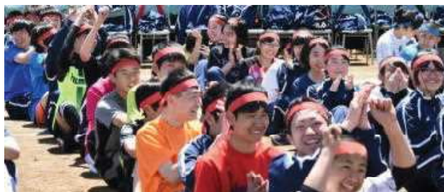
<5月26日(土)体育大会の様子>