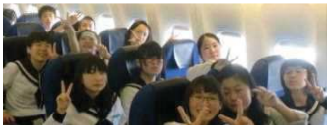
<5月9日(水)修学旅行の様子>

今後も継続した取り組みと学習環境の整備を進めます。ご家庭には、お子さんへの励ましや本校の取組へのご理解とご協力を宜しくお願いいたします。