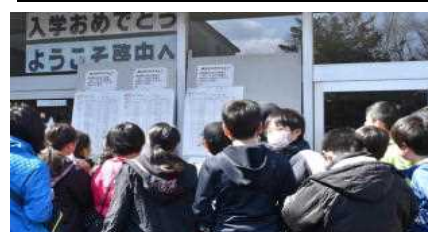
＜4月5日学級発表の様子＞