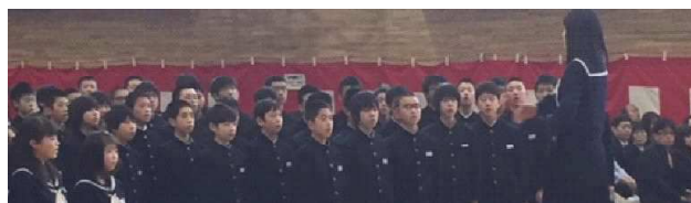
<第56回卒業証書授与式（3月14日）の様子>