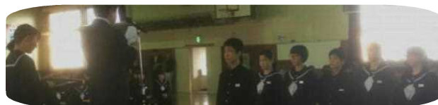
＜11/7 後期認証式の様子＞