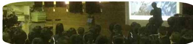
＜11/24 公開授業「おかえり先輩」の様子＞