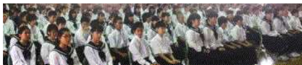
(8/21 2学期始業式の様子)

▶本校では、この他にも全校生徒対象の「学校生活についての生徒アンケート」を実施し、子ども達の意識や教育活動の成果と課題を客観的な数値結果をもとに検証しています。「授業は工夫されていて分かりやすい」「先生は間違った行動を適切に指導してくれる」など全27項目で構成されていますが、各項目とも概ね肯定的な回答数値となっています。「家庭学習の習慣」など、やや学年差が見られる項目もありますが、我々の教育実践に対する子ども達からの評価という視点をもって今後の学校改善に有効活用していきたいと考えています。1学期の評価結果については、本校のホームページに掲載していますのでぜひご覧ください。