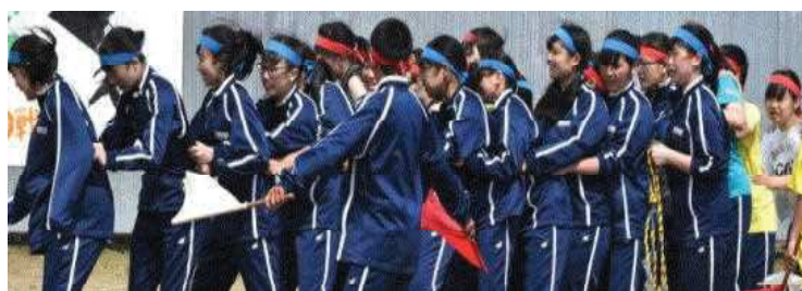
<5月29日(月)第56回体育大会の様子>