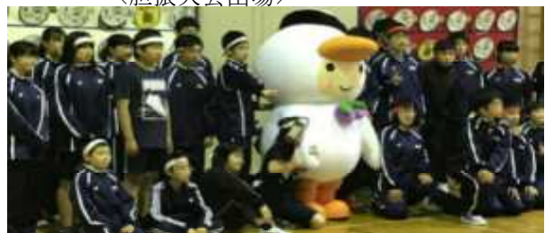
<6/22 山なみ分校体育大会の様子>