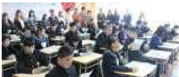
<4月8日入学式後の学級活動の様子>

終わりに。今年度の生徒会スローガンは「PRIDE」（一人一人が啓北の顔）です。子どもたちにとっても、職員にとっても、「愛着と誇りに思える啓北中学校」に。そのために必要なこと、行うべきことを積み上げていきたいと考えています。今年度も、どうぞよろしくお願い致します。