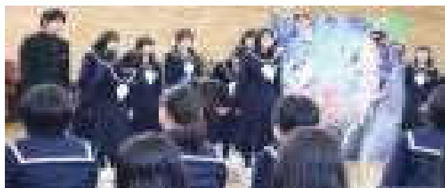
<4月10日新入生歓迎集会の様子>