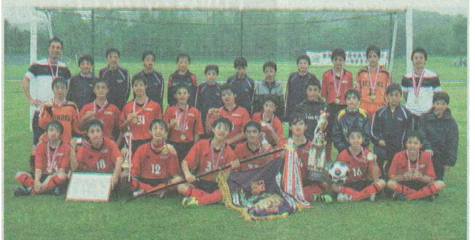
激闘を制し、大会2連覇を飾った啓北