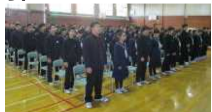
『3学期始業式の様子』

どうぞ、本年も本校教育の充実のため、保護者や地域の皆様のご支援とご協力をよろしくお願い申し上げます。