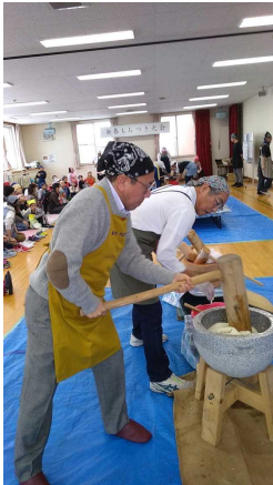
学校長も参加させていただきました。