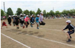
5年：大縄ぴよんぴよん