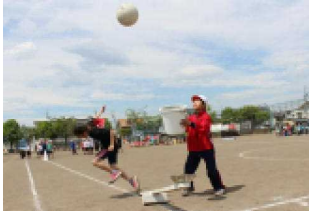
3年：ナイスキャッチ！！