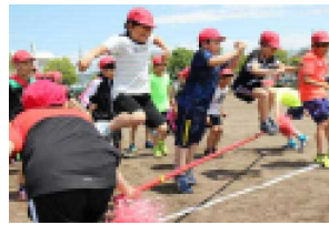
4年：明野タイフーン 令和1号