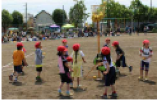
1年：ダンシング玉入れ