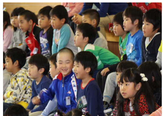
[1年生を迎える会より～はじける笑顔～]