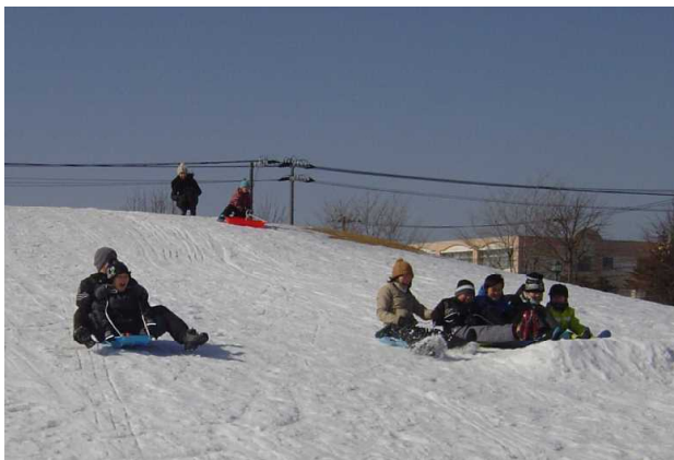
校外学習 そりすべり 2/20(金)

ほど前に花芽を付けたクンシランが、今が盛りと咲き誇っています。プリムラの赤や黄の鮮やかな色も嬉しいかぎりです。大きな花も小さな花も姿かたちが違っていても精一杯咲いている、その美し