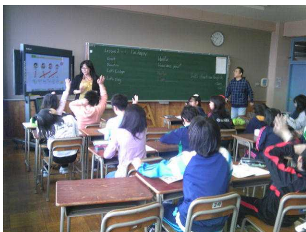
TTによる英語の学習 5年生