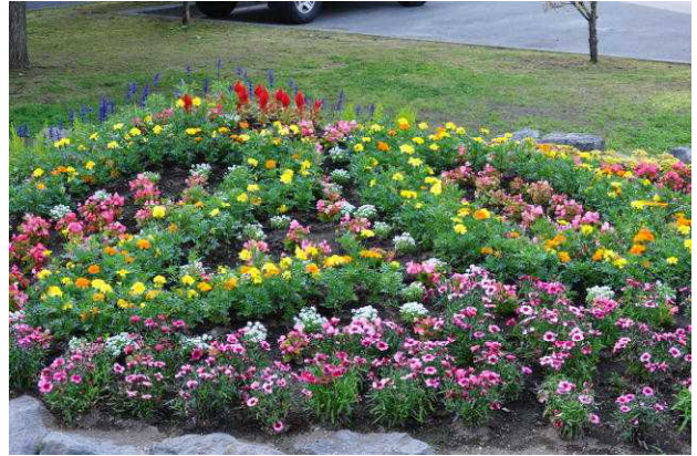
学校花壇コンクール「優秀賞」